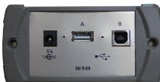
Рисунок 3 - Вид сбоку (электрические разъемы)